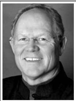
ഹാജർ ഹാണെഗ്രാഫ് എഴുതിയ Christianity in Crisis എന്ന പുസ്തകത്തിൽ നിന്ന് എടുത്തതാണ് ഈ ലേഖനം. ‘ദൈവത്തിന്റെ വിശ്വാസം’ എന്നതു പാതാ ന്യമമാണെന്ന് ഈ ലേഖനത്തിലൂടെ ഗ്രന്ഥകാരൻ സമർത്ഥിക്കുന്നു.