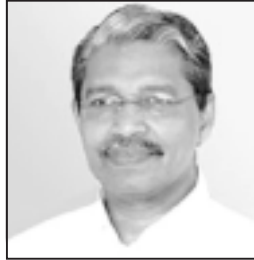
കർത്താവ് അത്ഭുതം പ്രവർത്തിക്കുന്നതു കാണാൻ പിന്നാലെ നടന്നവരുണ്ട്. പക്ഷേ അവരാരും ക്രിസ്റ്റിന്റേ ഏഴുലത്തു പോലും വന്നില്ല. ഇപ്പോഴത്തെ ഇല്ലാത്ത അത്ഭുതത്തിന്റെ പിന്നാലെ ജനം പരക്കം പായുന്നു. ഇതാണു സാക്ഷാത് അത്ഭുതം.

മുല്ലക്കരയും അത്ഭുതവും തമ്മിലുള്ള ബന്ധം ചക്കരയും ഈച്ചയും തമ്മിലുള്ള ബന്ധം പോലെ അഭേദമാണ്. എവിടെ മുല്ലക്കരയുണ്ടോ അവിടെ അത്ഭുതവും പറഞ്ഞാൽ. അമേരിക്കയിലെ സ്ഥിതിയും മറിച്ചല്ല. മുല്ലക്കര തട്ടിപ്പുകാരനാണെന്നും ഇയാൾക്കു പണം കൊടുത്തു വിഡ്ഢികളാകരുതെന്നും ഡിഫെൻഡർ പലവട്ടം പറഞ്ഞിട്ടും വിശ്വാസം വരാത്തവർ ഏറെയുണ്ട്. അങ്ങനെയുള്ളവർ മുല്ലക്കരയ്ക്കു പ്രോഗ്രാമും പണവും കൊടുത്തു വിഡ്ഢികളാകുന്നുമുണ്ട്.