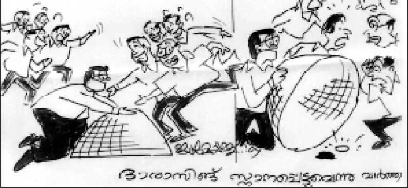
ദിവാസാനിഷ്ട് സ്കൂളാൻവെട്ടിപ്പോന്നു വാർത്ത