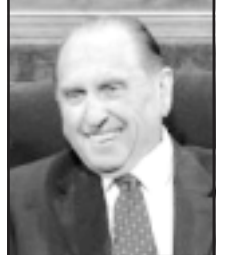
Thomas S. Monson

മൊർമോൺ പ്രസിഡന്റായ ഗോർഡൻ (97) അന്തരിച്ചു. തോമസ് മാൻസൻ അടുത്ത പ്രസിഡന്റായേക്കും. ജനുവരി 27ന് ആയിരുന്നു ഗോർഡൻ മരിച്ചത്. മൊർമോൺ പാരമ്പര്യമനുസരിച്ച് ഏറ്റവും മുതിർന്ന നേതാവാണ് പ്രസിഡന്റാകേണ്ടത്. ഇത്തവണയും ഈ കീഴ്വഴക്കം പിൻതുടർന്നാൽ മാൻസൻ പ്രസിഡന്റാകും.