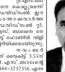
റാണെന്നു തോന്നുന്നു. സ്വന്തം ഭാര്യയെ ഉൾപ്പെടെ പലരെയും കൊന്ന വ്യക്തി പറയുന്നത് ഗൗരവത്തിൽ എടുക്കേണ്ട കാര്യമാണ്.