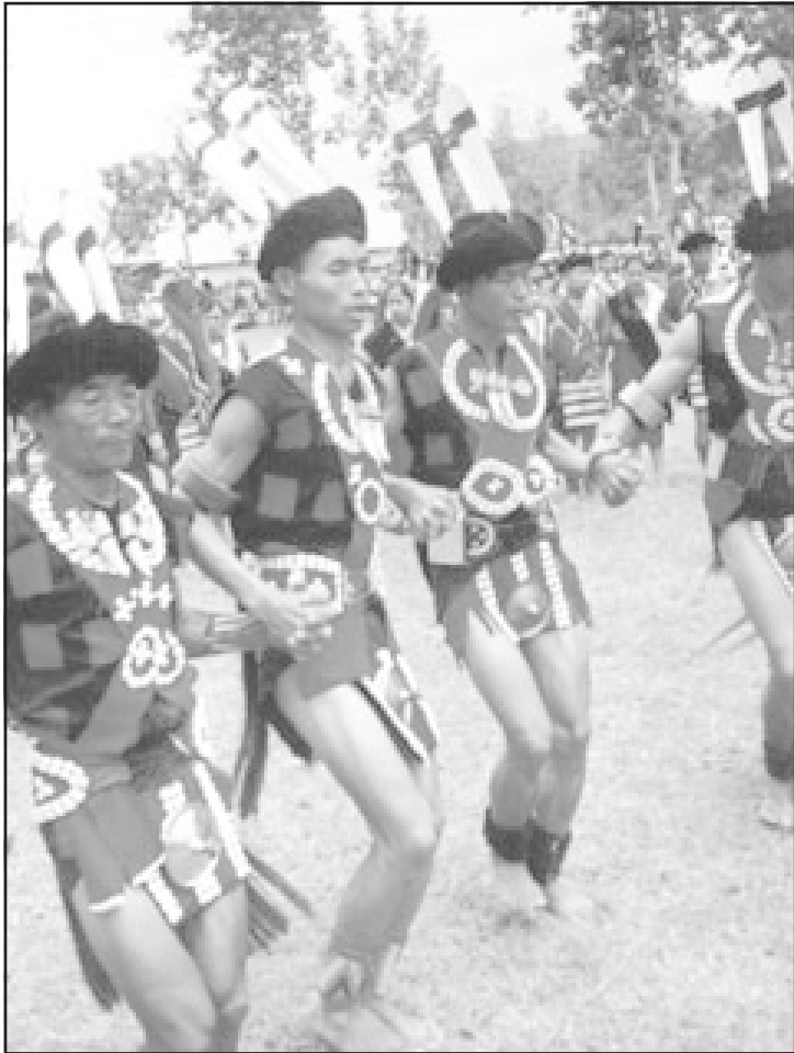
സങ്തം ഗോത്രക്കാരായ നാഗൻമാരുടെ നൃത്തം

ഒരു ക്രിസ്ത്യൻ സംസ്ഥാനമെന്നറിയപ്പെടുന്ന നാഗാലാൻ്റിൽ നിലനിൽക്കുന്ന ദയനീയമായ മദ്യസംസ്കാരത്തിന്റെ ഉത്തരവാദിത്വം വലിയൊരളവ് ഏറ്റെടുക്കേണ്ടത് അവിടെത്തെ സഭാനേതാക്കന്മാരാണ്. കുറെ ഉപരിപ്ലവങ്ങളായ ഉപദേശങ്ങൾ കൊടുക്കുന്നതിലും തകർപ്പൻ പ്രസംഗങ്ങൾ ചെയ്യുന്നതിലും മാത്രമാണ് ഇവർക്ക് താല്പര്യം. ക്രിസ്ത്യാനിത്വത്തിന്റെ മഹനീയ അനുഭവങ്ങളിലേക്ക് ജനത്തെ ഇറക്കുവാൻ ഇവർക്കാവുന്നില്ല. എന്തിനേറെപ്പറയുന്നു, ഇവരുടെ മക്കൾക്കുപോലും നല്ലവഴി കാണിച്ചുകൊടുക്കുവാൻ ഇവർക്കു കഴിയുന്നില്ല. നാഗാലാൻ്റിലെ വഴിപിഴിച്ച മക്കളിൽ വലിയൊരു പങ്ക് സഭാനേതാക്കന്മാരുടെ സന്തതികളാണ്.