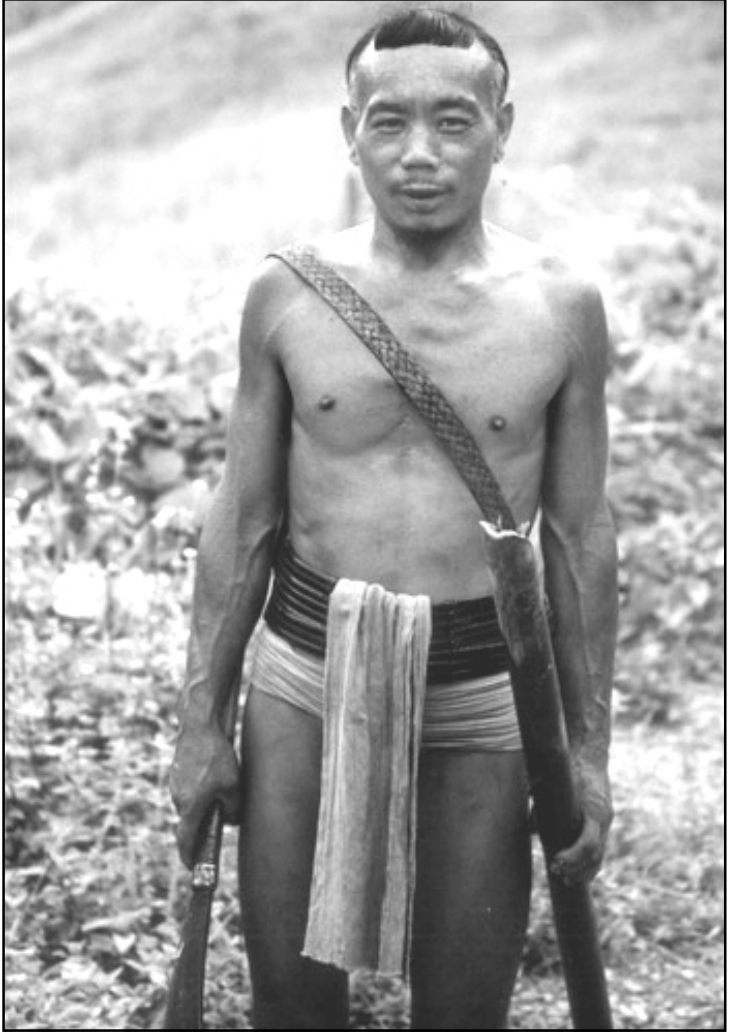
കൊന്യാക് ഗോത്രക്കാരനായ നാഗൻ

നാഗാലാൻ്റിലെ രാഷ്ട്രീയത്തെപ്പറ്റി ശരിയായി മനസ്സിലാക്കാൻ സാധിച്ചത് ദിമാപുരിലായിരിക്കുകയാണ്. 'ആയാറാം, ഗയാറാം' പ്രമാണമാണ് നാഗാലാൻ്റിൽ സ്ഥിരമായി നടന്നുവരുന്നത്. ഞങ്ങളുടെ സ്കൂളിന്റെ ഉടമസ്ഥൻ എത്രവട്ടം കാലുമാറിയിരുന്നോ, ഏതെല്ലാം പാർട്ടികളിൽ എപ്പോഴൊക്കെ ആയിരുന്നെന്നോ അദ്ദേഹത്തിനുതന്നെ ഓർമ്മയുണ്ടാവില്ല.