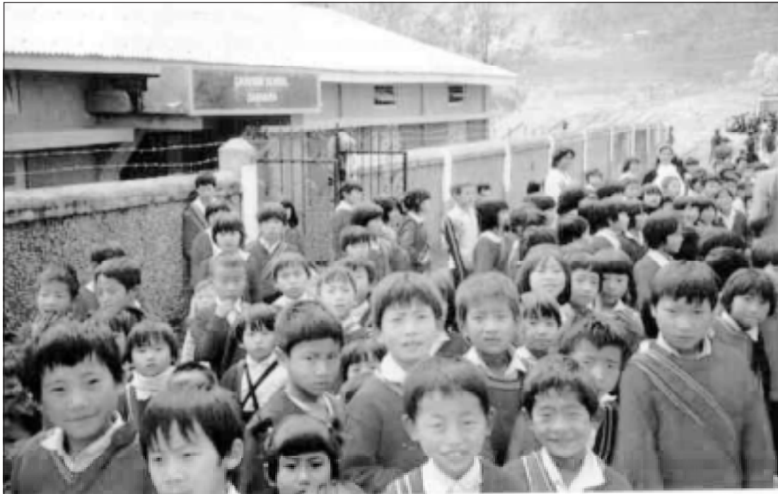
നാഗാലാൻ്റിലെ സ്കൂൾ കുട്ടികൾ

ഡിസംബർ 10-ാം തീയതി ഉച്ചയായപ്പോഴേയ്ക്കും പ്രസവവേദനയാരംഭിച്ചു. പ്രസവസംബന്ധമായ വിഷയങ്ങളിൽ അനേകവർഷത്തെ പരിചയമുള്ള രണ്ടുമാസം വയസ്സികളെ ഉടൻ വിവരം അറിയിച്ചു. അവർ എത്തിനും തയ്യാറായി എത്തി. കടുകെണ്ണയെടുത്തു തയ്യാറാക്കിവെച്ചു. കുട്ടിയുടെ പൊക്കിൾ മുറിക്കുവാൻ ഈറ്റയുടെ പുറംപൊളിയുമെടുത്തു. തയ്യാറെടുപ്പെല്ലാം കണ്ടപ്പോൾ കാര്യം ഉടൻ കഴിയുമെന്ന് എനിക്കും തോന്നി. താമസിയാതെ അവരെല്ലാം കൂടി എന്റെ ഭാര്യയെ എണ്ണ തേച്ചു തിരുമ്മാനാരംഭിച്ചു. സഹായത്തിന് എന്നേയും വിളിച്ചെങ്കിലും ഞാൻ പോയില്ല. കേരളത്തിൽ പ്രസവമെന്നത് സ്ത്രീകളുടെ കുത്തകയായതിനാൽ പുരുഷന്മാരെ ആ പ്രദേശങ്ങളിൽ വരാൻപോലും അനുവദിക്കാറില്ലല്ലോ. നാഗാലാൻ്റിലും പ്രസവം സ്ത്രീകളാണ് നടത്തുന്നതെങ്കിലും സഹായത്തിനു പുരുഷന്മാരെ വിളിക്കും. ഭർത്താവ് ഒരു കസേരയിൽ ഇരുന്ന് നിലത്തിരിയ്ക്കുന്ന ഭാര്യയെ താങ്ങി സഹായിക്കണമെന്നതാണ് നടപടിക്രമം. പക്ഷേ എനിക്ക് ഇതിനൊന്നുമുള്ള തന്റേടമുണ്ടായില്ല. അതുകൊണ്ട് വേണ്ടതെല്ലാം ചെയ്യാൻ അമ്മയെ ചുമതലപ്പെടുത്തി. സമയമങ്ങനെ കടന്നുപോയ്ക്കൊണ്ടിരുന്നു. എന്നാൽ പ്രസവം നടന്നില്ല. ഗവൺമെന്റ് ആശുപത്രിയിൽ ചെന്ന് ഒരു നേഴ്സിനെ കൂട്ടിക്കൊണ്ടുവരുന്നതു നല്ലതാണെന്ന അഭിപ്രായമുണ്ടായി. അങ്ങനെ ഞാൻ പുറപ്പെട്ടു. സമയം രാത്രി പത്തുമണി.