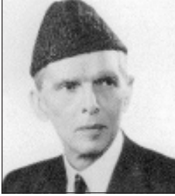
മുഹമ്മദ് അലി ജിന്ന

തികച്ചും അപ്രതീക്ഷിതമായാണ് പാകിസ്ഥാന്റെ രാഷ്ട്രപിതാവായ മുഹമ്മദ് അലി ജിന്ന ഈയിടെ വിവാദപുരുഷനായത്. പാകിസ്ഥാൻ സന്ദർശനത്തിനിടയിൽ ബി.ജെ.പി. അദ്ധ്യക്ഷനായ എൽ.കെ.അദാനി ജിന്നയെ മതേതരവാദിയായി അംഗീകരിച്ചുകൊണ്ട് നടത്തിയ പരാമർശങ്ങളാണ് വിവാദങ്ങൾക്ക് തിരികൊളുത്തിയത്.