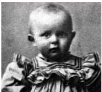
ജോൺ പോൾ രണ്ടാമൻ ശിശുവായിരുന്നപ്പോൾ